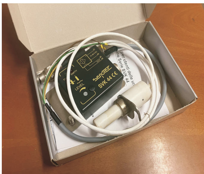
Sensore di livello (optional)