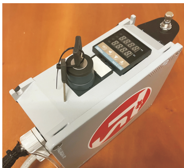
Particolare del quadro di comando remotabile

Tecnosalgo è un marchio di Tiesse srls 31020 Sernaglia della Battaglia (TV)